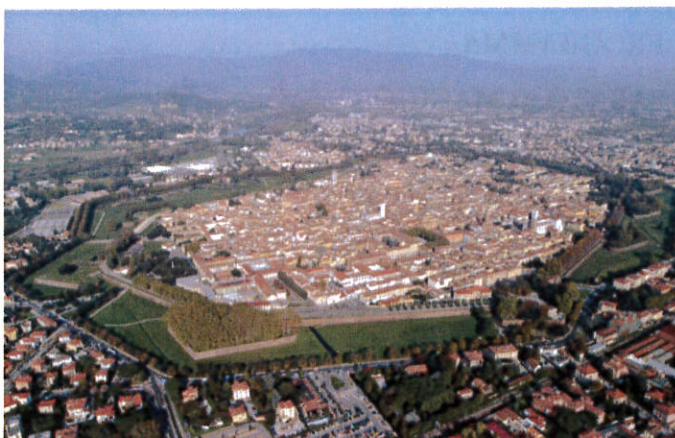
Veuta aerea di Lucca

Viale Europa Unita, 117 - 33100 Udine (UD) telefono e fax: 0432 295663 www.udine.uoei.it - uoei.udine@gmail.com